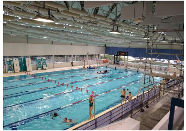
Bassin et gradins intérieur